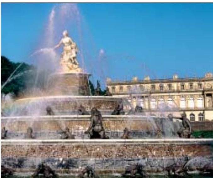
Kleine Rechtsgeschichte – 1948